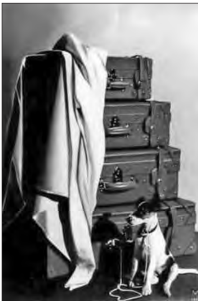
Dragan Malešević Tapi – Putovanje (ulje na platnu)