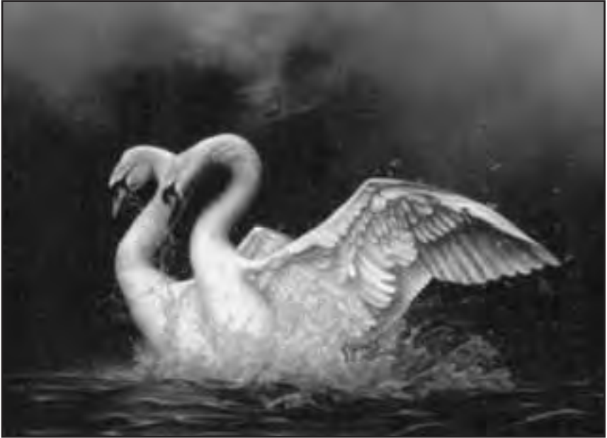
Dragan Malešević Tapi – Symphony in blue (ulje na platnu)