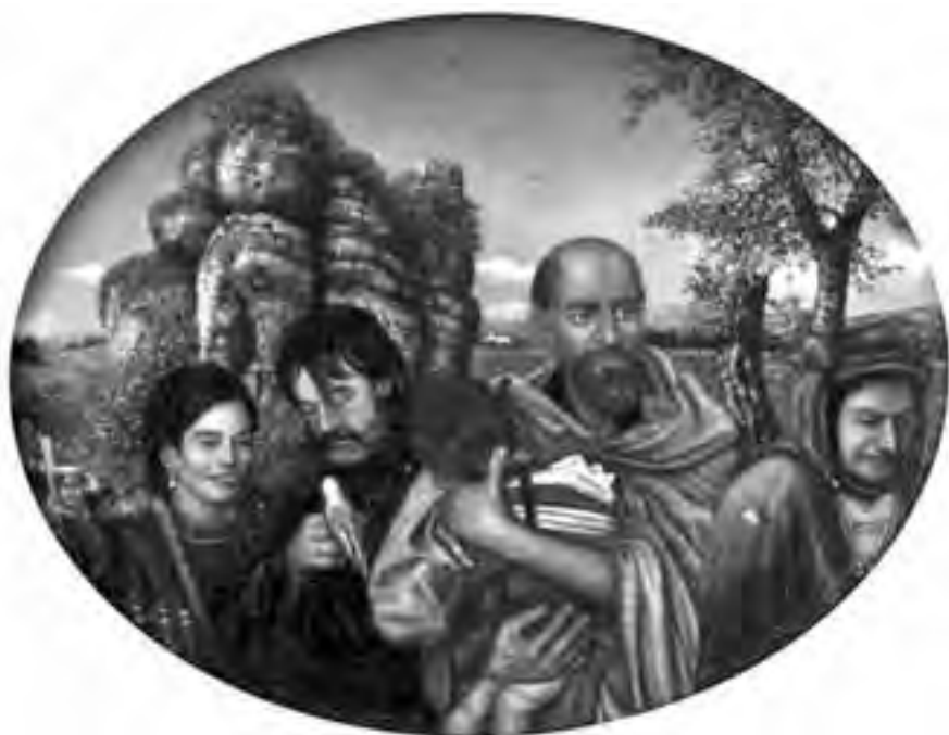
Dragan Malešević Tapi – Egzodus (ulje na platnu)