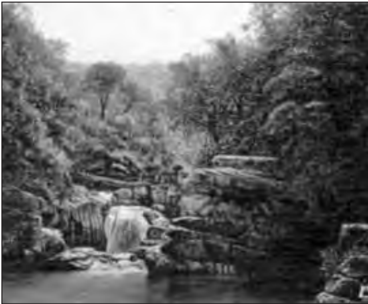
Dragan Malešević Tapi – Drina (ulje na platnu)

Key words: restriction of freedom of association, speech of hatred, harassment and degrading behavior, establishing the responsibility of an association, necessary need of society to restrict freedom of association