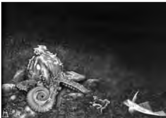
Dragan Malešević Tapi – Octopus (ulje na platnu)

Key words: restriction of freedom of association, speech of hatred, harassment and degrading behavior, establishing the responsibility of an association, necessary need of society to restrict freedom of association