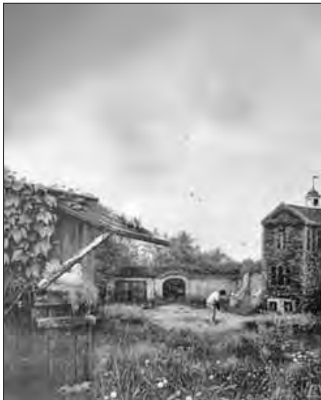
Dragan Malešević Tapi – Osamnaesta rupa (ulje na platnu)