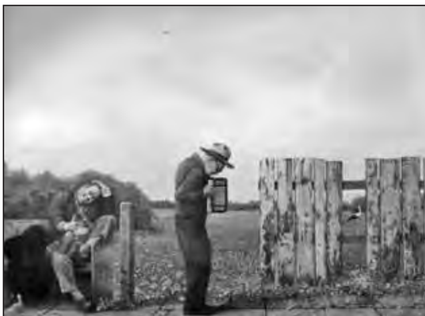
Dragan Malešević Tapi – Radost bankrota (ulje na platnu)