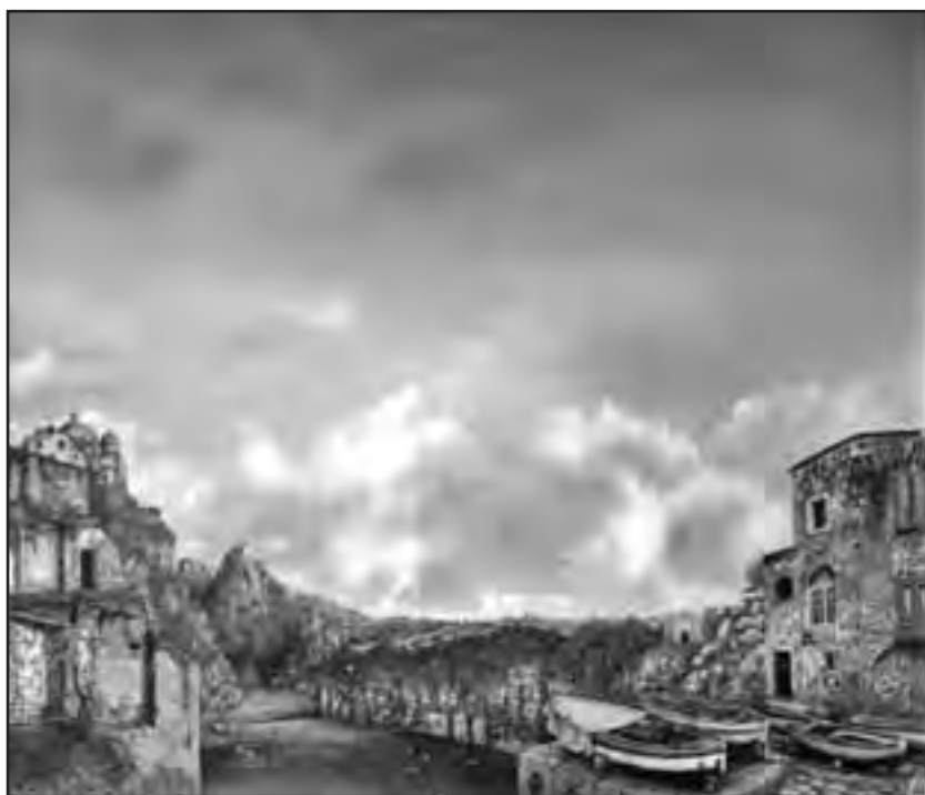
Dragan Malešević Tapi – Templum (ulje na platnu)