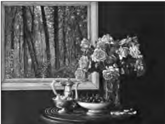
Dragan Malešević Tapi – Ruže (ulje na platnu)